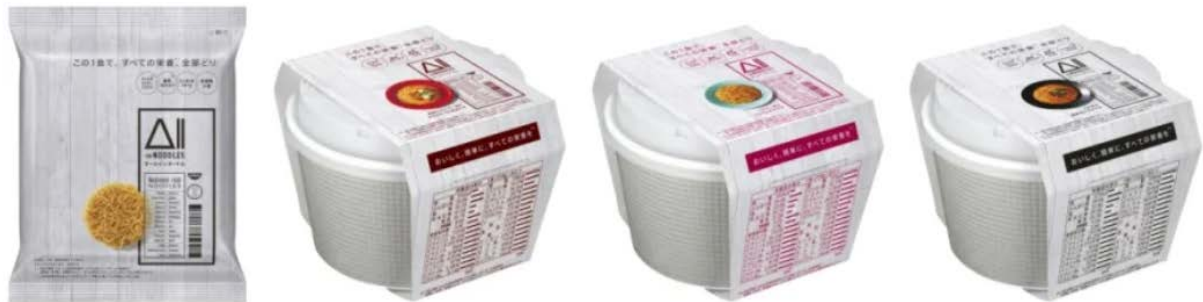
All-in Noodles รสชาติต่างๆ ของ Nissin

จะเห็นได้ว่า การทำตลาดของผลิตภัณฑ์ All-in Noodles เป็นการยกระดับตลาดบะหมี่กึ่งสำเร็จรูปขึ้นไปอีกขั้น เพราะก่อนหน้านี้บะหมี่กึ่งสำเร็จรูปมักถูกมองว่าเป็นอาหารที่ไม่ค่อยมีประโยชน์ ดังนั้น การที่บะหมี่กึ่งสำเร็จรูปมีสารอาหารเพิ่มมากขึ้น สามารถช่วยให้ผู้บริโภคได้รับสารอาหารที่เป็นประโยชน์ต่อร่างกายมากขึ้นด้วย