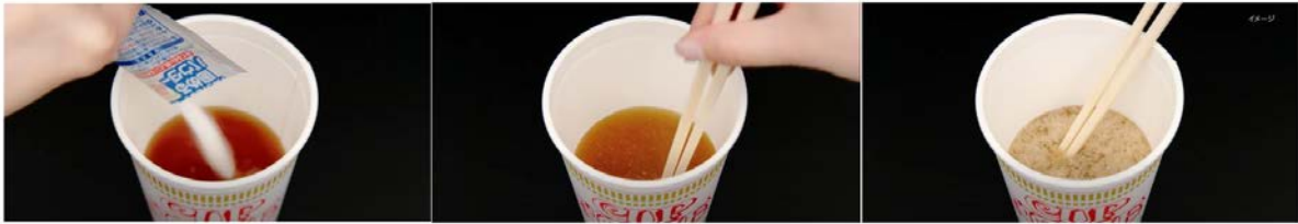
ภาพแสดงวิธีการใช้ผงกำจัดน้ำซุปล

นวัตกรรมสุดเจ๋งยังไม่จบแค่เพียงการเพิ่มโปรตีน นิชิชินร่วมมือกับบริษัท Kobayashi Pharmaceutical ในการพัฒนาตัวช่วยจัดการน้ำซุปลที่เหลือในถ้วยบะหมี่ เพื่อให้ง่ายการจัดการของเสียอีกด้วย โดยการใช้ผงเรซินที่มีคุณสมบัติดูดซึมน้ำได้ดี ซึ่งนิยมใช้ในผลิตภัณฑ์ผ้าอ้อมเด็กสำเร็จรูป วิธีการเพียงเทผงเรซินนี้ลงไปใต้น้ำซุปลที่เหลือ จากนั้นคนเป็นเวลา 10 วินาที น้ำซุปลจะเริ่มจับเป็นก้อนแข็ง สามารถนำก้อนซุปลนั้นทิ้งพร้อมกับถ้วยกระดาษได้